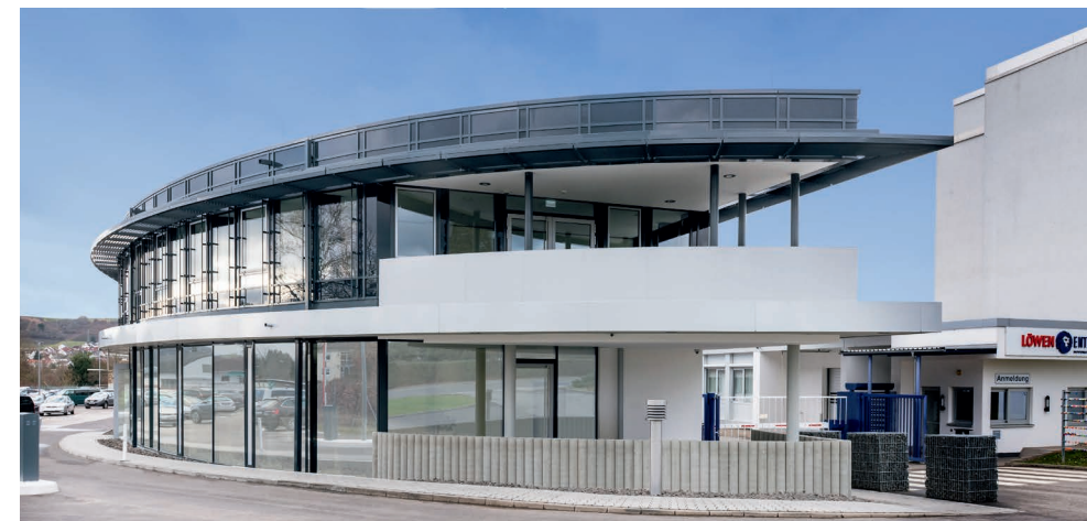
Unser Service-Zentrum in Bingen am Rhein

Alle Trainingsinhalte werden als Handout oder in elektronischer Form zum Nachschlagen bereitgestellt.